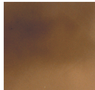
DS 6156 コーヒーブラウン