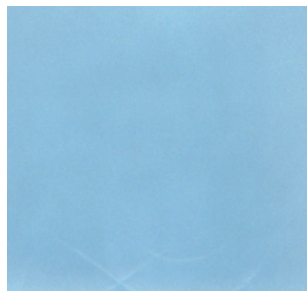
DS 4068 ライトコバルトブルー