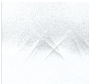
DS 0189 クリア (厚み3・4・6・8 mmの4種)